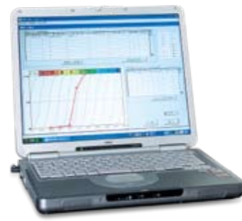
Neo専用データアナライザー (Windows XP専用)