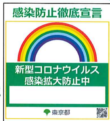
感染防止徹底宣言ステッカー

1. 該当する業種のチェックシートで 店舗等で実施している感染防止対策の 実施状況を確認してください