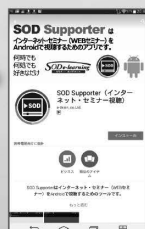
【SOD Supporter】 インストール画面