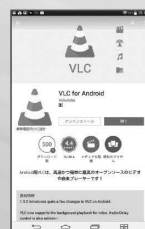
【VLC for Android】 インストール画面

※ インターネット・セミナーはパソコンやスマホ・タブレットなどを使い、映像コンテンツを視聴することで、様々なセミナーを受講したり経営情報が取得できるサービスです。 ※ スマホ・タブレットで視聴するためには、専用ソフト(無料)をインストールする必要があります。 ※ スマホ・タブレットは、Androidのみの対応となります。