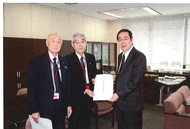
右から 内藤自治税務局長、柳田税制委員長、長谷川税制副委員長