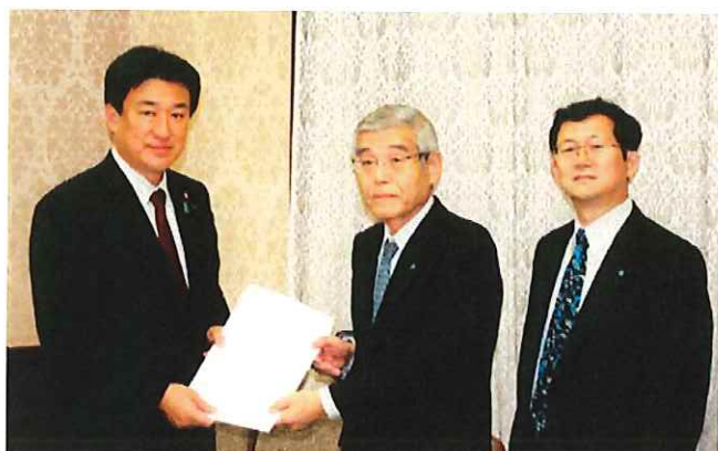
左から 木原財務副大臣、柳田税制委員長、横山専務理事