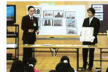
税務署の方と小学校で租税教室を開催