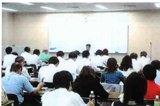
税務署で法人税の基礎講座を開催