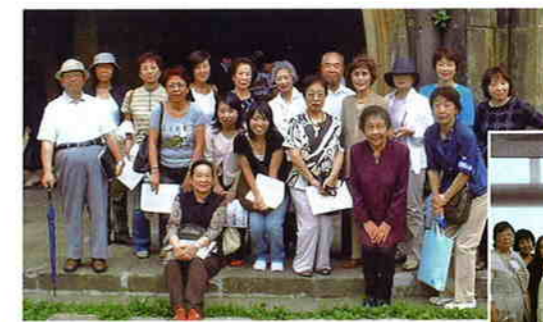
本郷界隈の散策を楽しむ女性部会

若手経営者を対象とした青年部会、女性経営者や従業員を対象とした女性部会が設けられており、同じような立場にある会員同士が、研究会や親睦活動等特色ある活動を活発に行なっています。また、従業員50人以上を対象とした源泉部会では源泉所得税に関する勉強会を開催しています。