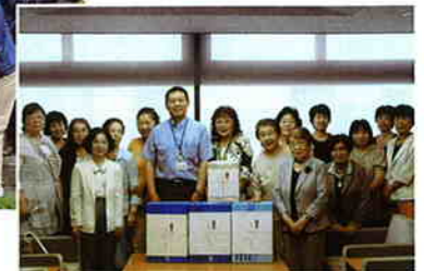
成澤区長に未使用タオル170本を寄贈