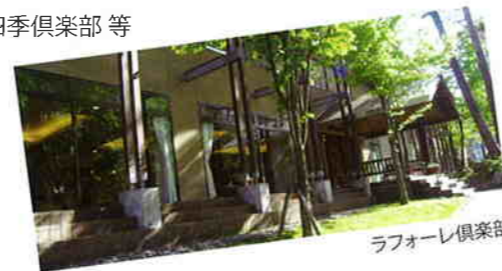
ラフォーレ倶楽部