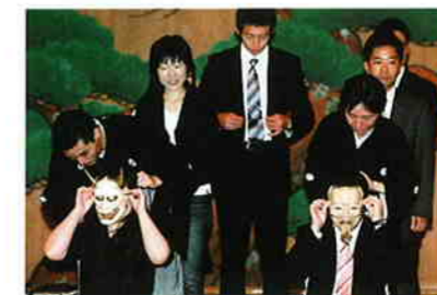
「能・狂言」鑑賞の夕べ